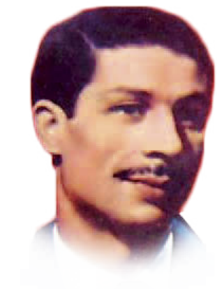
Dahmane El Harrachi

Dans une ambiance embuée par la nostalgie et chauffée par la pression des demis, les clients – issus de cette population à part qui est pourtant une part de la population française – buvaient les paroles de ces musiciens qui leur ressemblaient tant. Comme beaucoup d'entre eux, ils exerçaient des travaux pénibles pendant la semaine et attendaient impatiemment le week-end pour s'enivrer d'un peu d'airs du « bled ».