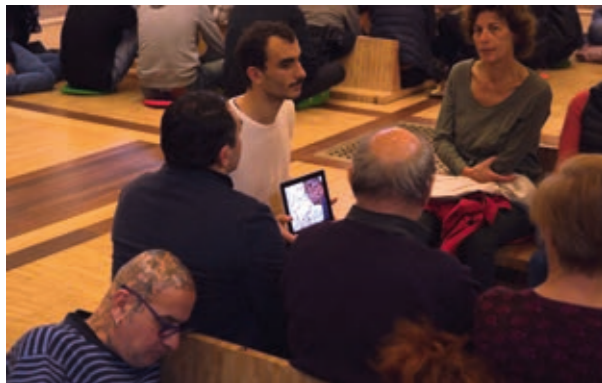
Je passe Babi © Medhat Soody