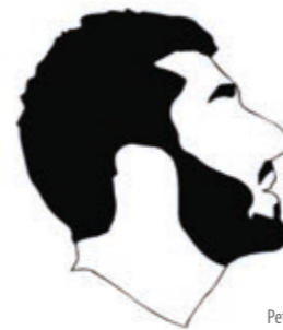
Petit Copek

ATK (Paris), vingt ans après sa formation, a voulu créer un pont entre ses premiers auditeurs et les plus récents. Le groupe publie On fait comme on a dit , en 2018, un album mêlant le boom-bap classique du hip-hop aux sonorités actuelles et nous délivre leur vision d'adolescents devenus adultes dans un monde en constante évolution.