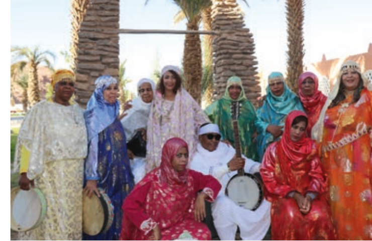
L'ensemble Lemma.

Après avoir vécu à l'étranger de nombreuses