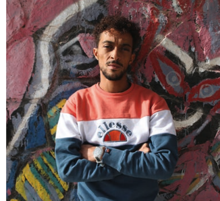
Demi Portion