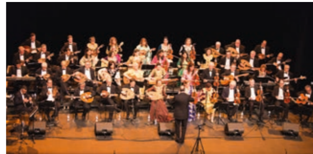
El Mawsili © Marie Braun

■ Entrée libre, préinscription obligatoire sur www.imarabe.org