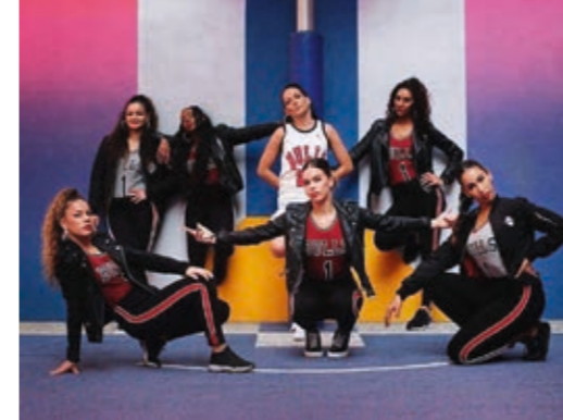
Fanny Polly © Margaux Birch